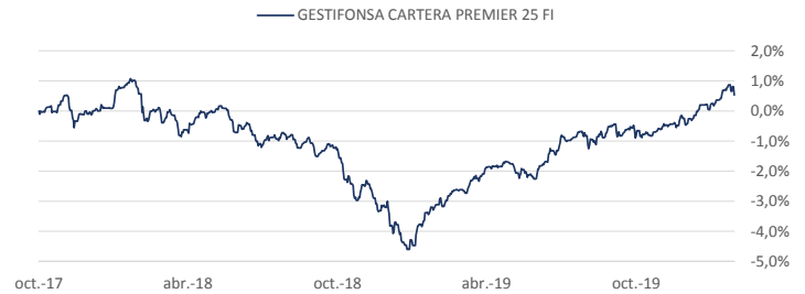
Rentabilidades acumuladas (No hay evidencia mínima suficiente para mostrar todos los periodos)